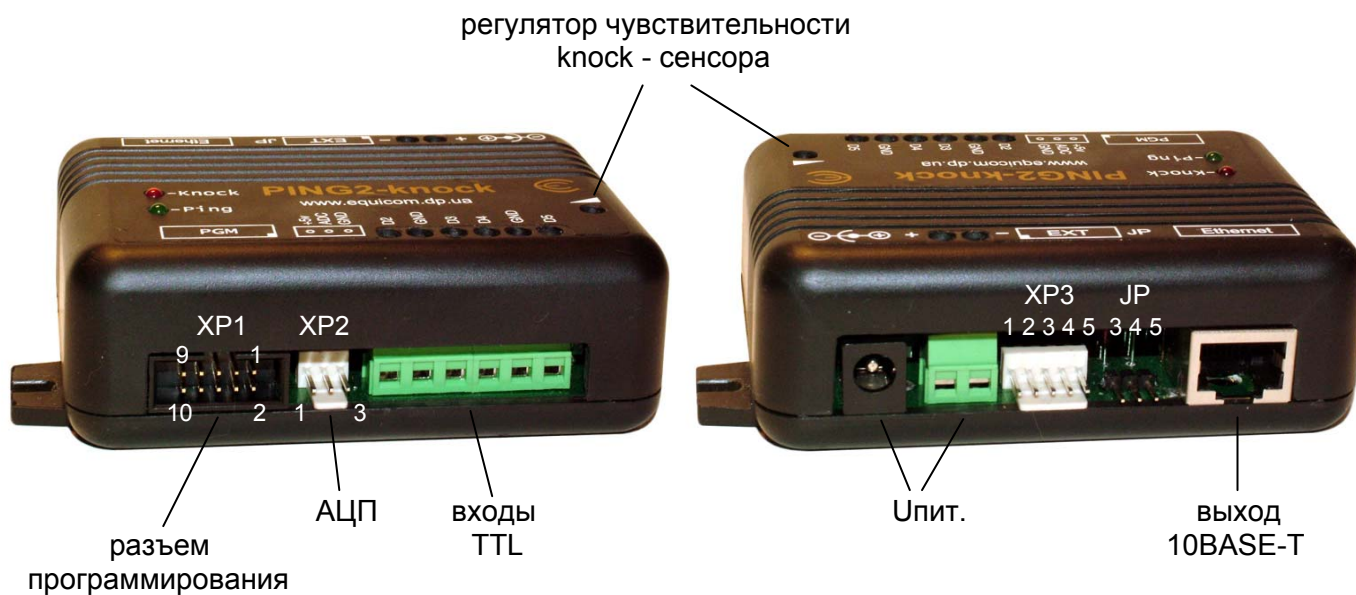
Рис. 1 PING2-knock